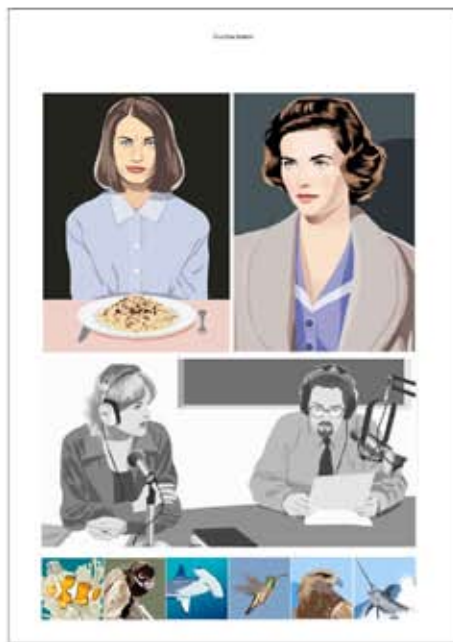
Ilustración navideña para la empresa suiza de audifonos phonack.